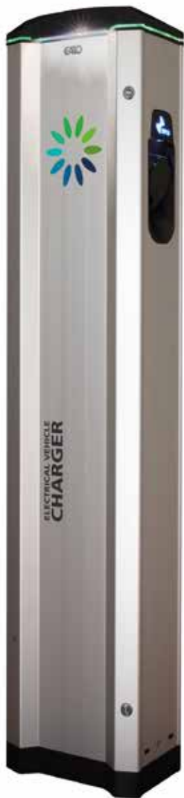
LS4 MAAHAN ASENNETTAVA Korkeus: 1400 mm